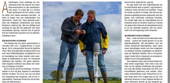
Een persoon die een tablet gebruikt in een veld, mogelijk gerelateerd aan weerdata en gewasbescherming.

Bestuursondersteunende systemen (BOS) zijn in de akkerbouw niet nieuw, maar het gebruik ervan is nog niet de standaard. Met weerdata over perceelvisu