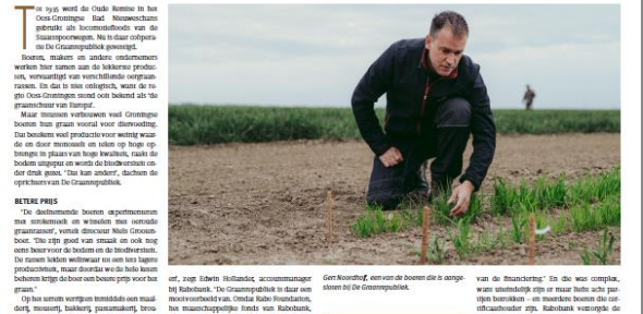
De Graanrepubliek in Noordboast-Groningen.

In De Graanrepubliek in Noordboast-Groningen werken boeren, makelaars en andere ondernemers samen in korte ketens. Tegelijk met het telven van de lekkerste granen wordt de biodiversiteit verbeterd. Ook wordt samen-